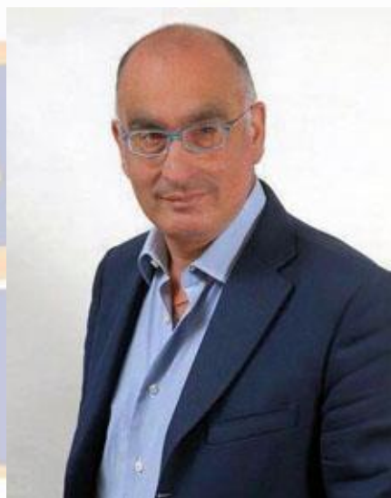
Presidente: Raffaele DI PIPPO